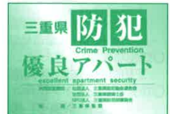
認定プレート(建物の外壁へ掲示します)

共同認定機関/公益社団法人 三重県防犯協会連合会、一般社団法人 三重県建築士会、NPO法人 三重県防犯設備協会 後援/三重県警察