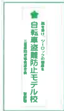
盗難被害防止活動