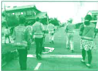
地域安全運動の推進